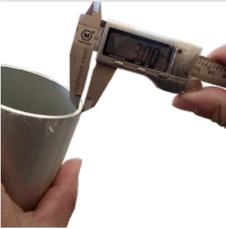
Mât central aluminium Ø76mm épaisseur 3mm