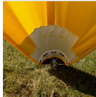
Renforts sur angles de la bâche pour un solide maintien du sabot