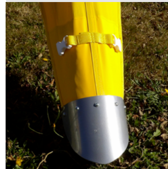
Solides sabots métalliques pour un ancrage optimal