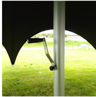
Manivelle pour ajuster la tension de la bâche de toit